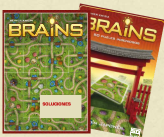
1 librito con las primeras pistas y soluciones