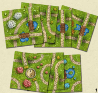
7 fichas de Jardín